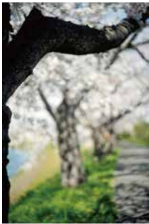
No.1: © Terri Weifenbach "Saitama Notes #8896, 2019"