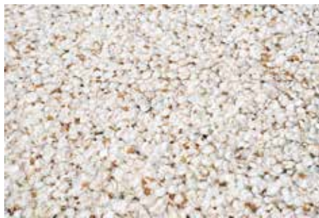
No.5: © Terri Weifenbach "Saitama Notes #9468, 2019"