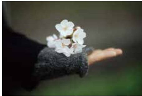
No.2: © Terri Weifenbach "Saitama Notes #7941, 2019"