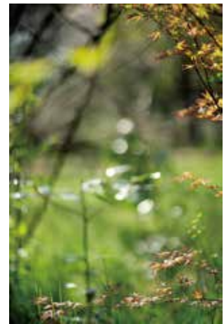
No.6: "Saitama Notes #9732, 2019"