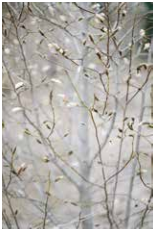
No.4: © Terri Weifenbach "Saitama Notes #7918, 2019"