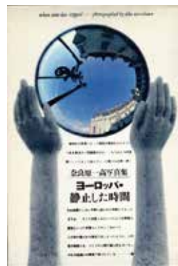
奈良原一高 写真集 “ヨーロッパ・静止した時間” 鹿島研究所出版会, 1967