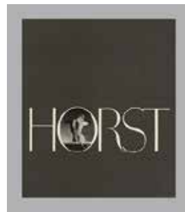
Horst P. Horst “Horst, His Work and His World” Alfred A. Knopf, 1984