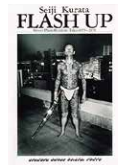
倉田精二 写真集 “FLASH UP” (サイン本) 白夜書房, 1980年