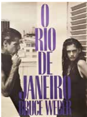
Bruce Weber “O Rio De Janeiro” Knopf, 1986