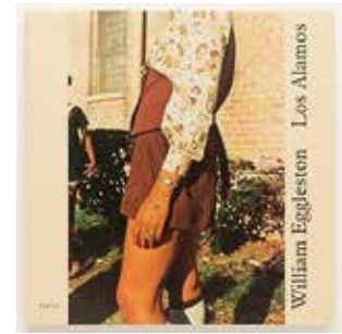
William Eggleston “Los Alamos” Scalo, 2004