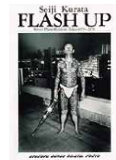
倉田精二 写真集 “FLASH UP” (サイン本) 白夜書房, 1980年