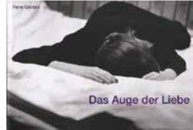
Rene Groebli “Das Auge Der Liebe” Sturm & Drang, 2017