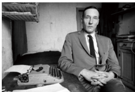
No.2 "William Burroughs, 1960"