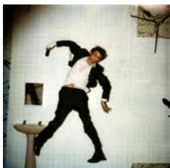
No.5 "David Bowie, Loger , 1979"