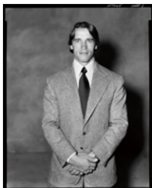
No.4 "Arnold Schwarznegger, 1977"