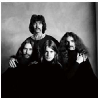
No.7 "Black Sabbath, 1973"