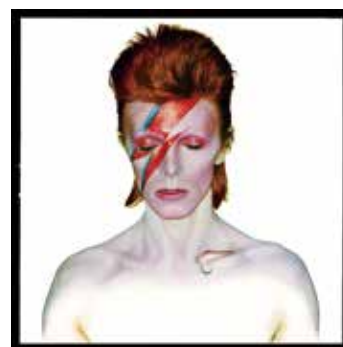
No.6 "David Bowie, Alladin Sane , 1973"