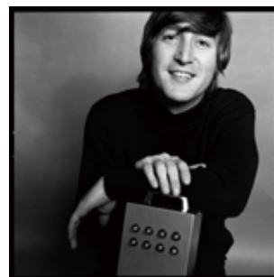
No.3 "John Lennon, 1965"