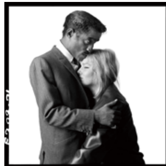
No.8 "Sammy Davis, Jr. and May Britt, 1966"